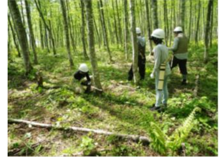
春の林業体験の様子