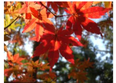
紅葉（水源の森にて）

※交流会は開催見送りとさせていただきます 温泉と星空などをゆっくりお楽しみ下さい