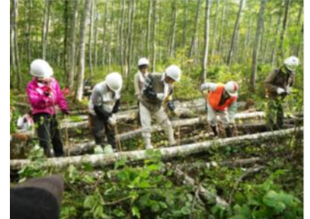
秋の林業体験の様子

13:00 「ならまた体験活動の森」 森づくりボランティア ～林業体験（間伐等）～